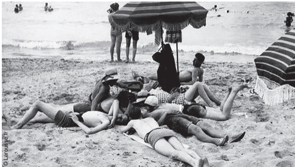
1936, premiers congés payés.